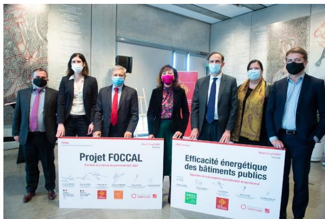
Signature de la convention partenariale FoCCAL

L'outil FoCCAL permettra d'investir durablement dans les centres-villes et viendra compléter de manière efficace l'offre d'ingénierie foncière en place sur les territoires afin de garantir la bonne fin des projets.